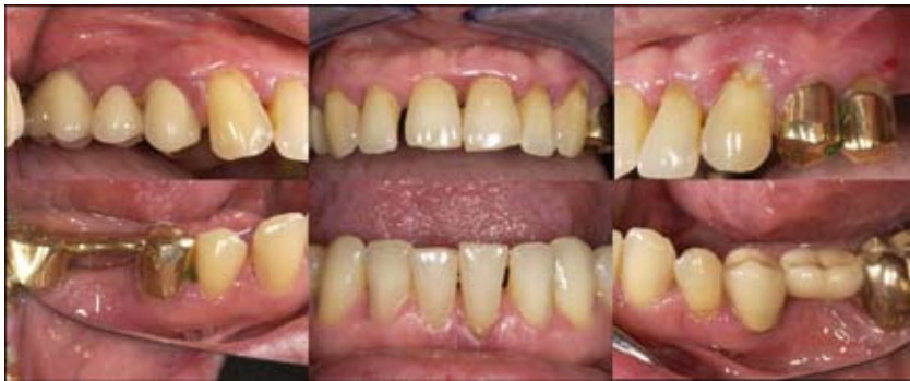
Abb. 1: Schwere chronische Parodontitis bei Typ 2 Diabetes