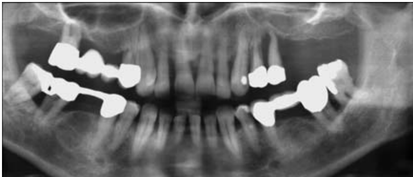
Abb. 2: Radiografisch sichtbare Zerstörung des alveolären Knochens bei chronischer Parodontitis

dagegen diabetesspezifisch, sie sind Folge der Hyperglykämie. Die neuropathischen Spätkomplikationen sind zum Teil diabetesspezifisch. Bei der peripheren sensomotorischen Polyneuropathie spielt der Alkoholgenuss eine bedeutende Rolle.