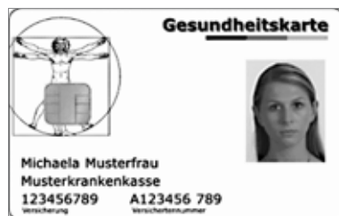
So soll sie aussehen: die elektronische Gesundheitskarte 2011

Die Finanzierungsvereinbarung zwischen den Landesverbänden der Krankenkassen und der KZV Mecklenburg-Vorpommern ist mittlerweile abgeschlossen. Mit Schreiben vom 29. März wurden die Zahnarztpraxen über ihre individuellen Ansprüche an Refinanzierungspauschalen informiert. Die Refinanzierung über die Pauschalen läuft bis zum 30. September. Bis zu diesem Datum haben die Zahnarztpraxen Zeit, die Kartenterminals zu installieren, die ent-